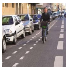
Bande cyclable avec espace tampon de 0,5 m

La bande cyclable est une partie de la chaussée réservée aux cyclistes et aux conducteurs d'engins de déplacement personnel motorisés (EDPM).